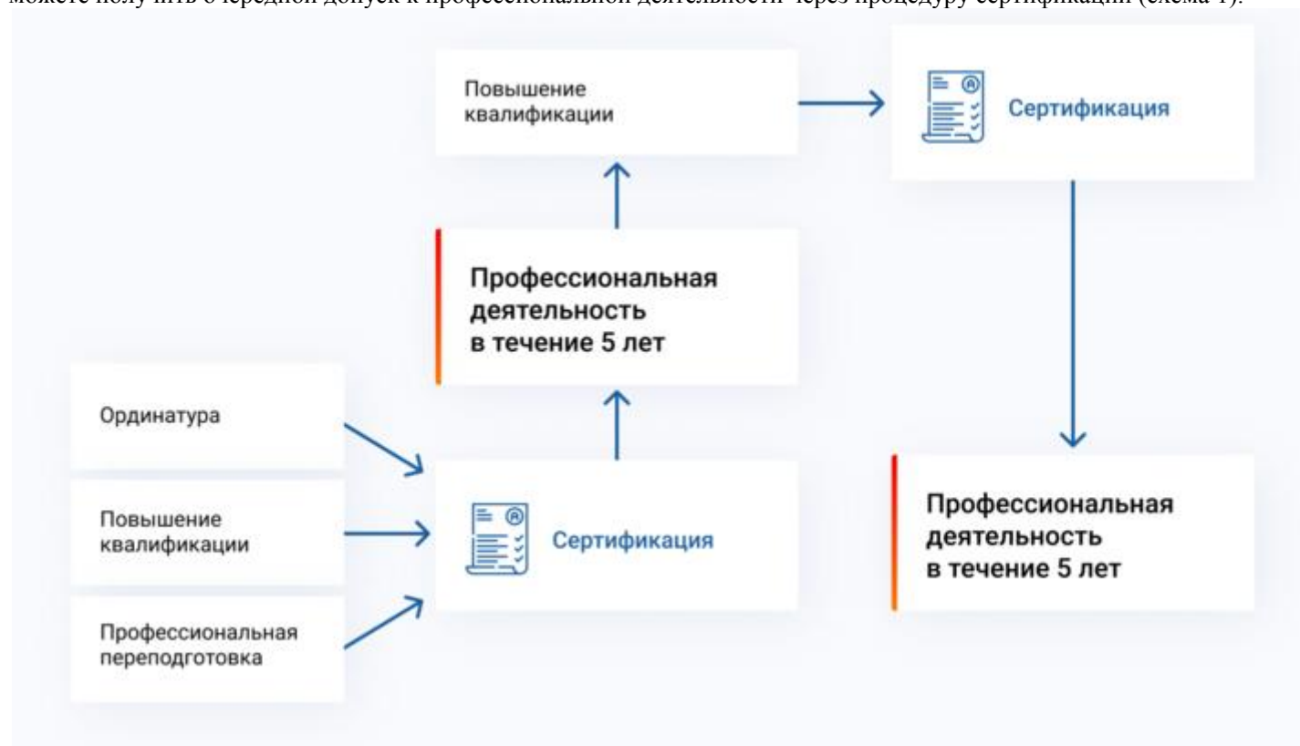
Схема 1. Допуск к профессиональной деятельности через сертификацию специалиста

Если имеющийся у Вас сертификат специалиста был получен до 1 января 2016 года, то до 1 января 2021 года Вы можете получить очередной допуск к профессиональной деятельности через процедуру сертификации (схема 1).