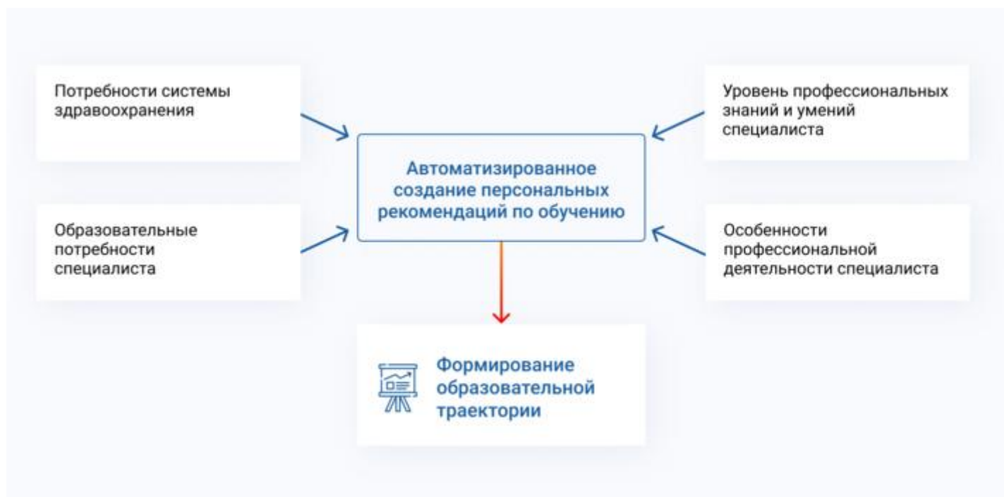
Схема 5. Механизм формирования образовательной траектории