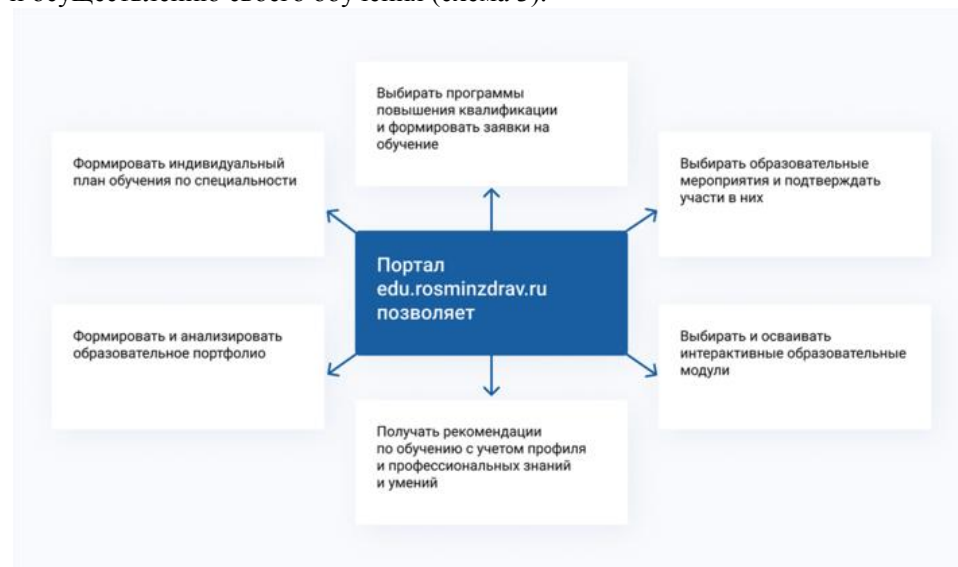
Схема 3. Возможности специалиста при работе на Портале

Зарегистрированные пользователи Портала получают доступ к широкому спектру возможностей по планированию и осуществлению своего обучения (схема 3).