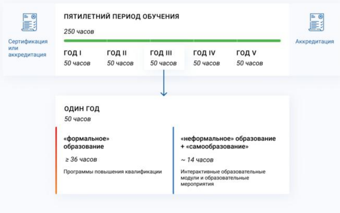
Схема 4. Рекомендации по объему, графику обучения и долевого распределению различных компонентов непрерывного образования

С целью непрерывного совершенствования профессиональных навыков и расширения квалификации, а также для обеспечения допуска к периодической аккредитации специалистам здравоохранения рекомендуется обучение с общим минимальным суммарным объемом различных компонентов непрерывного образования не менее 250 ЗЕТ за пятилетний период с ежегодным обучением в объеме около 50 ЗЕТ. В суммарный пятилетний объем образовательной активности рекомендуется включать не менее 180 ЗЕТ обучения по программам повышения квалификации и суммарно около 70 ЗЕТ освоения интерактивных образовательных модулей и обучения на очных образовательных мероприятиях. Рекомендуемый ежегодный объем освоения программ повышения квалификации и суммарный объем обучения на очных образовательных мероприятиях и освоения интерактивных образовательных модулей составляют примерно 36 и 14 ЗЕТ соответственно (схема 4).